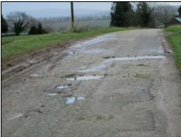
La Hayère avant