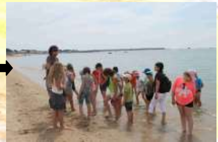
Premiers instants dans l'eau, quel pied !