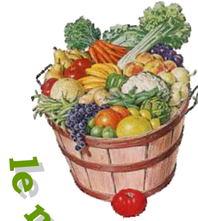
le marché à la ferme