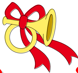
le comité des fêtes