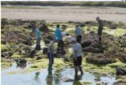
Pêche à pied. Nous avons pêché beaucoup d'animaux, certains ont rejoint l'aquarium et les autres ont été relâchés.