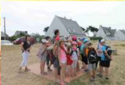
Visite des alentours du centre.