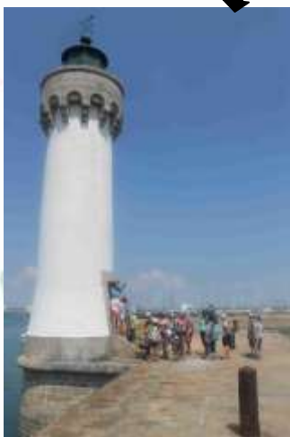
Visite du port de plaisance. Nous sommes montés dans un ancien phare. Vue et vertige assurés !