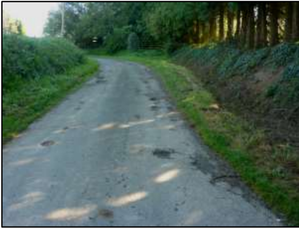
La Cour Landais avant