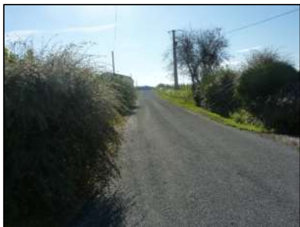
L'entrée du village de Biry