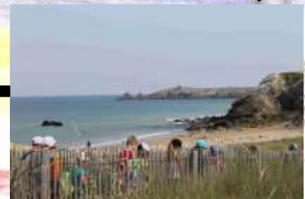
Visite de la côte sauvage.