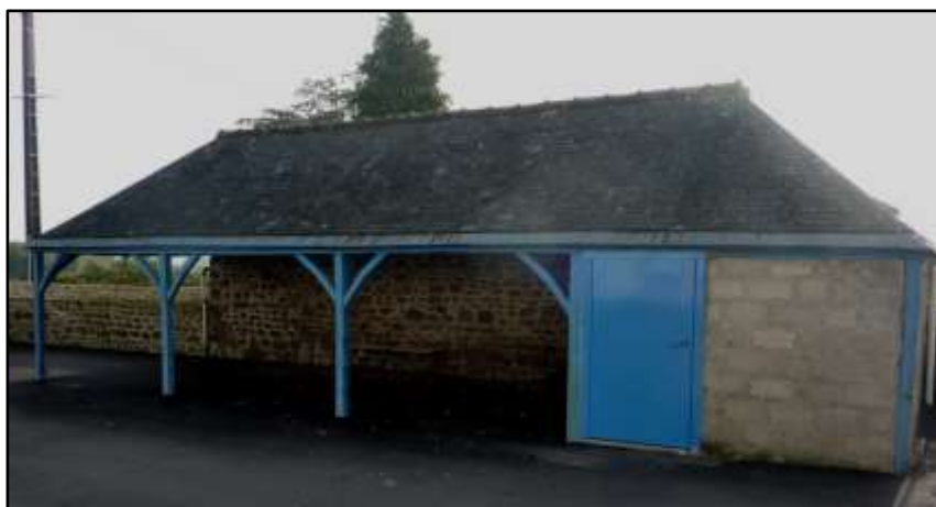
Restauration du préau