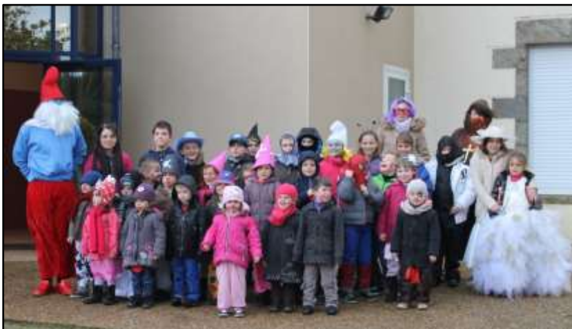
Journée Carnaval 2014