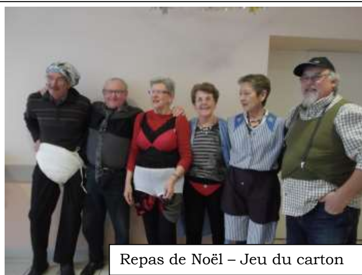
Repas de Noël – Jeu du carton