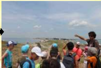
Voici l'isthme de Saint-Pierre Quiberon, qui est une presque île.