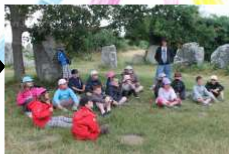
Visite des alignements de Ker Zhero. Nous avons vu des menhirs géants.