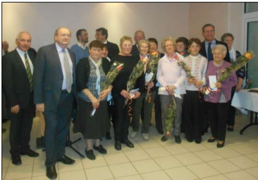
BRAVO A TOUS LES LAUREATS DU CONCOURS DE MAISONS FLEURIES

Les lauréats du concours des maisons fleuries se sont vus récompensés, et ont reçu de la part des membres de la commission municipale, un diplôme, un bon d'achat et une magnifique rose.