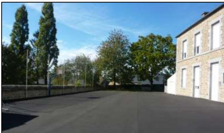
Revêtement total de la cour