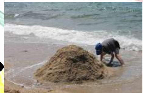
Pour comprendre comment tient une dune, il suffit d'essayer d'en fabriquer une.