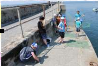
Pêche au carrelet.