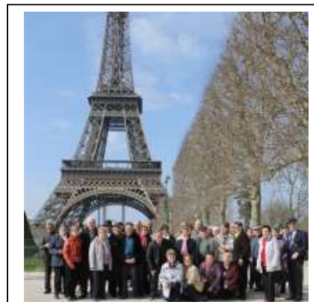
Voyage Paris et Assemblée

Du 20 au 27 Juin : Croisière sur l'ADRIATIQUE et les ILES GRECQUES.