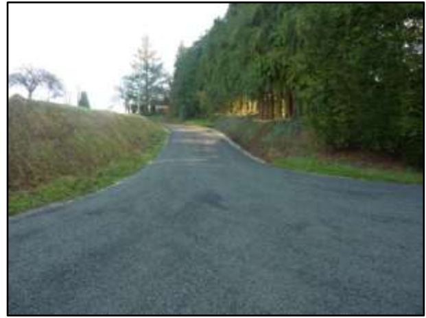
La Cour Landais après